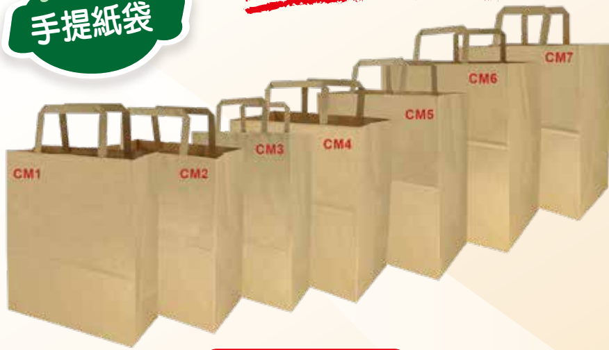
公私版印刷參考圖